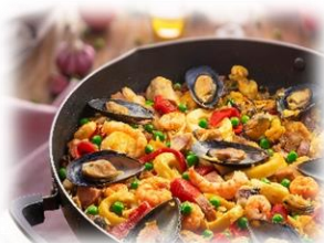
Arroz de marisco