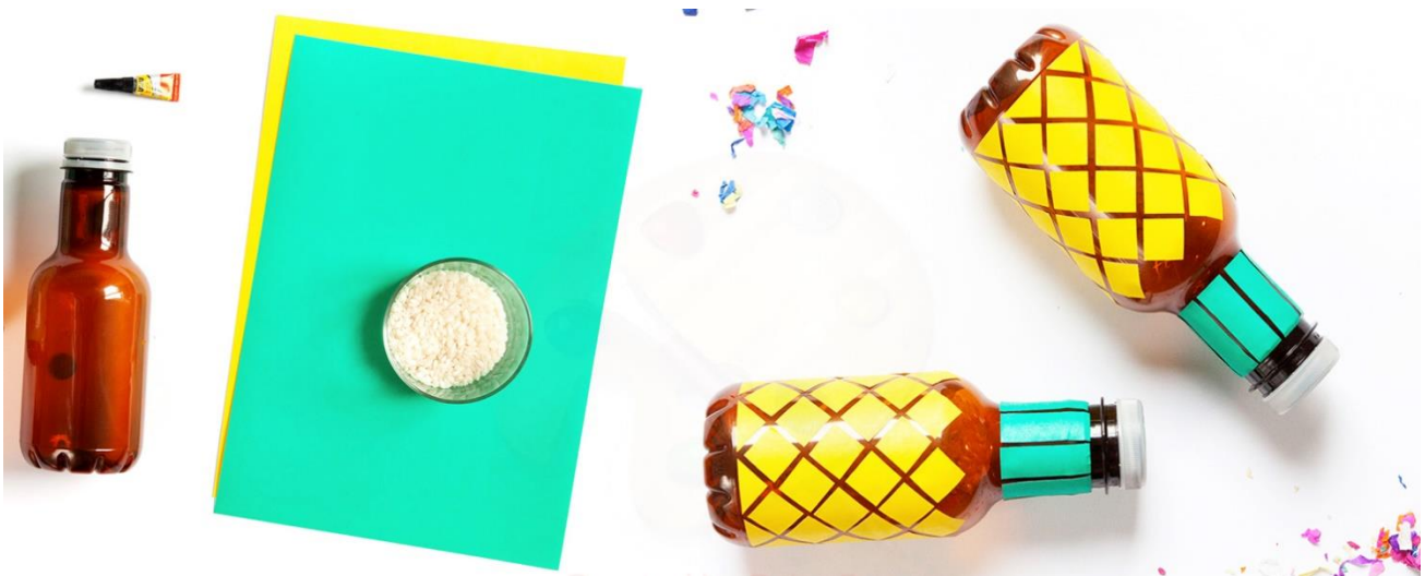
Construção de Maracas.