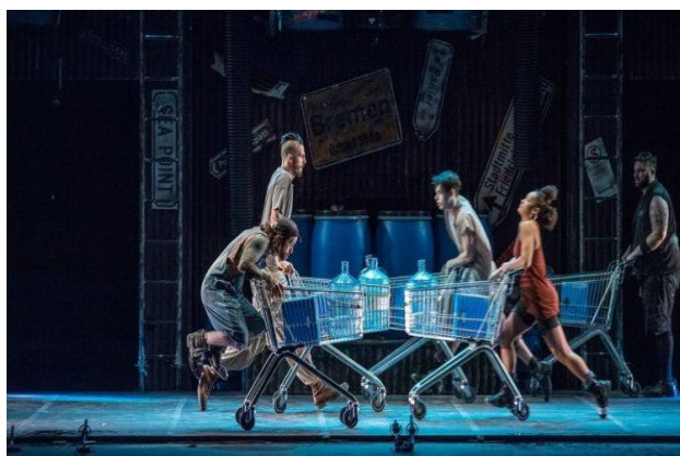
STOMP Out Loud (1997), filme co-realizado por L. Cresswell e S. McNicholas,