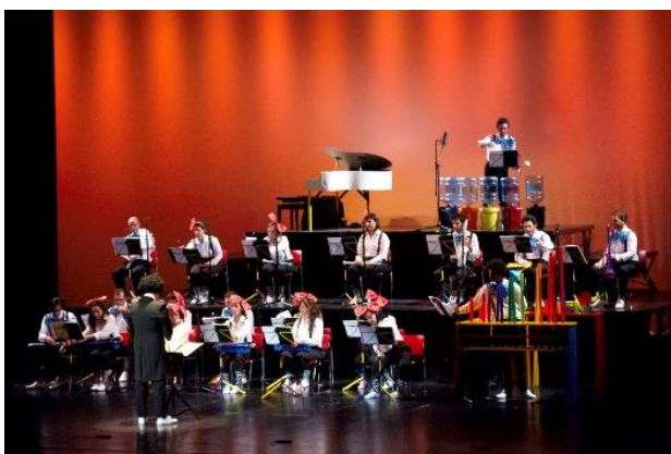
Orquestra dos Brinquedos de Lisboa em Concerto.