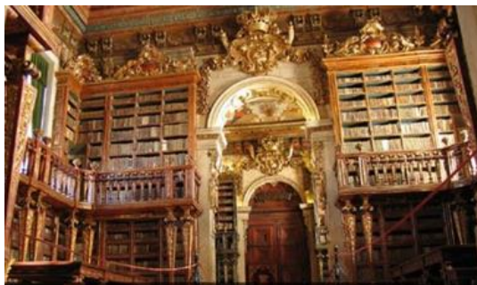
Biblioteca Joanina da Universidade de Coimbra