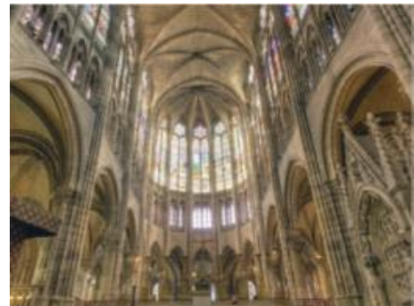
Sé Velha de Coimbra