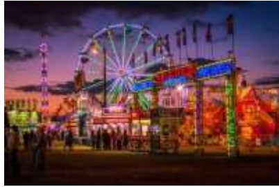
Parque de diversões: