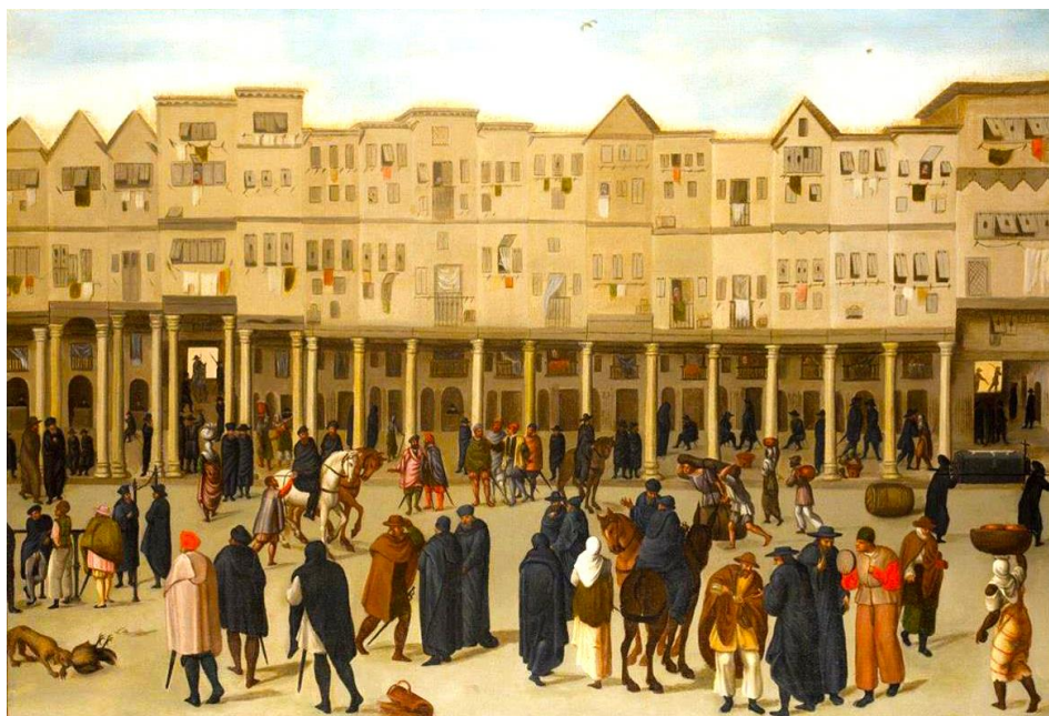
Documento 1 - Rua Nova dos Mercadores em Lisboa no século XVI. Autor anónimo