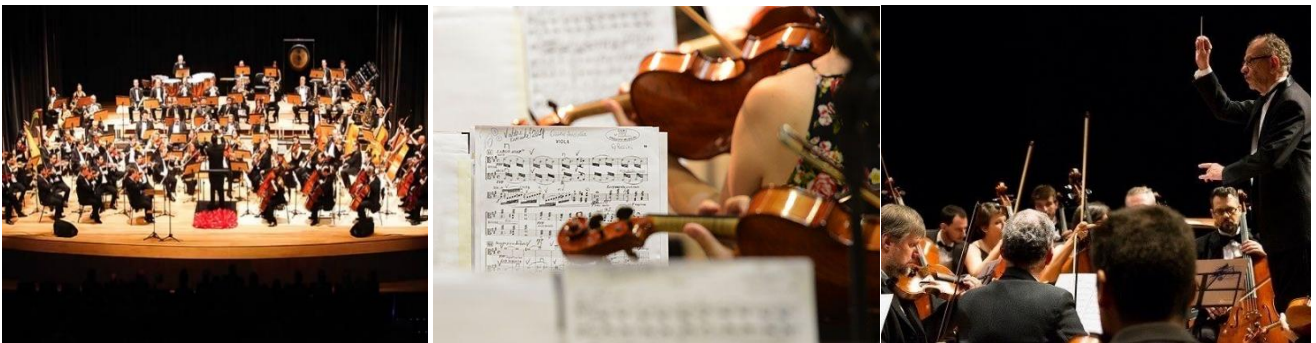
Uma Orquestra Sinfónica em concerto