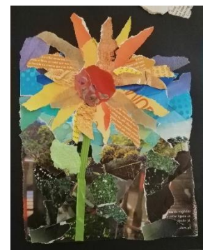
Imagens de trabalhos apresentados durante a aula n.º 3.