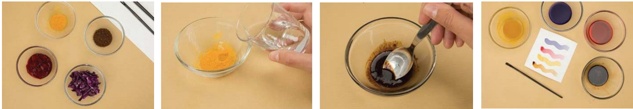
Preparação de tintas naturais com ingredientes naturais.