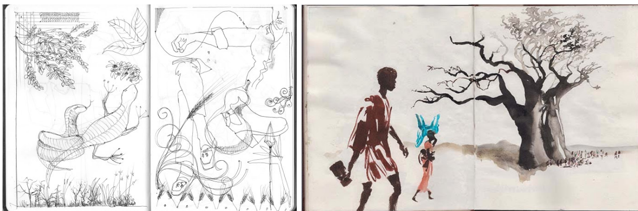
Pedro Cabral, Diário Gráfico (Urban Sketchers Portugal), 2020.