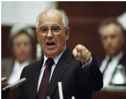
Doc. 3 - Mikhail Gorbachev