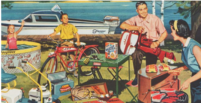
Doc. 2 - Cartaz publicitário americano