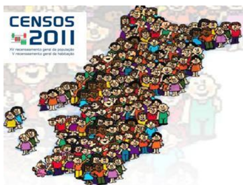
Documento 3- Censos 2011

1.1. Identifica o nome do estudo que, de 10 em 10 anos, recolhe informação sobre a população de um país.