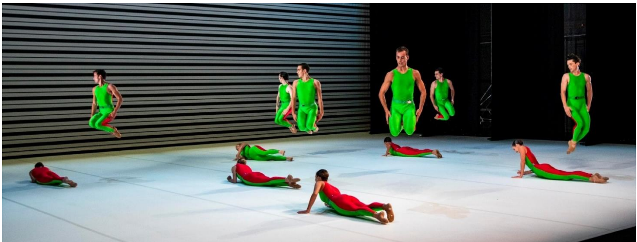
Adagio Hammerklavier + Short cut + In the future , Hans Van Manen/Companhia Nacional de Bailado.