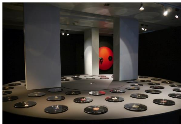
EXPOSIÇÃO Museu do Fado O Fado e o Teatro (2013). Coprodução Museu do Fado e Museu Nacional do Teatro.