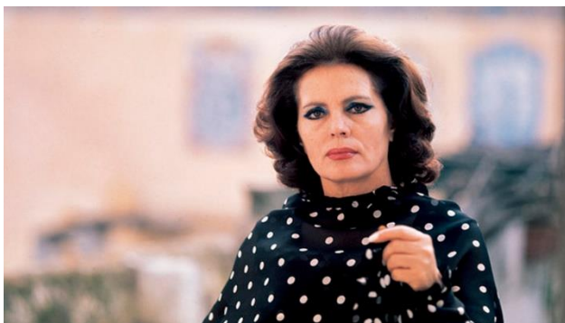
A fadista Amália Rodrigues (1920-1999).