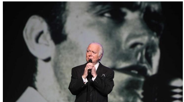
O fadista Carlos do Carmo em concerto (2019).