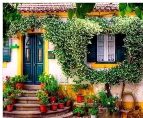
Greatest Hits of Amália Rodrigues , que inclui Uma Casa Portuguesa - 1.ª faixa, 2014.